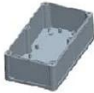
Hypotheca (1PCS) Material:ABS Color:Light Grey(FS20412)