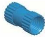
Copper Nut(6PCS) Material:Copper Standard:M4*10 Color:Copper