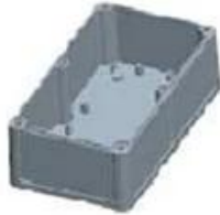
Hypotheca (1PCS) Material:ABS Color:Light Grey(FS20412)