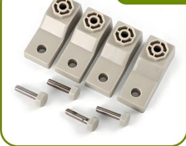
Mounting Corner Brackets