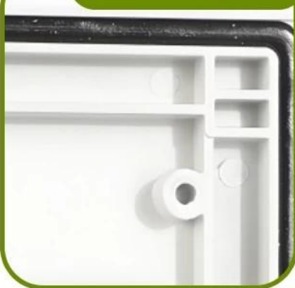
Integrated One-Piece Sealing Gasket