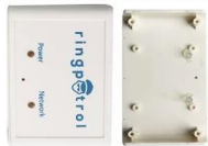
HOT MELT TREATMENT