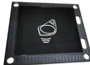
CUSTOM PC PLATE