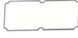
Gasket (1PCS) Material:Rubber