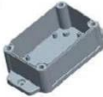
Hypotheca (1PCS) Material:ABS Color:Light Grey(FS20412)