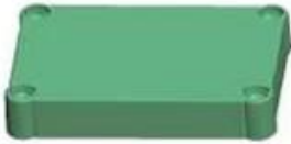
Epitheca (1PCS) Material:ABS Color:Light Grey(FS20412)