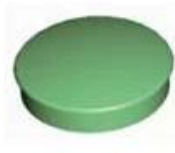
Screw Lid(6PCS) Material:ABS Color:Light Grey(FS20412)