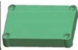
Epitheca (1PCS) Material:ABS Color:Light Grey(FS20412)