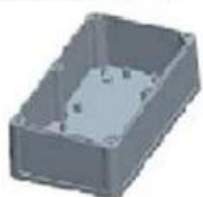
Hypotheca (1PCS) Material:ABS Color:Light Grey(FS20412)