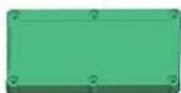
Epitheca (1PCS) Material:ABS Color:Light Grey(FS20412)