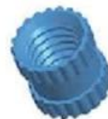
Copper Nut(4PCS) Material:M4*5 Color:Copper