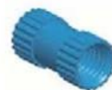
Copper Nut(6PCS) Material:Copper Standard:M4*10 Color:Copper