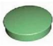
Screw Lid(6PCS) Material:ABS Color:Light Grey(FS20412)