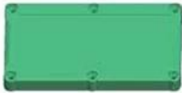
Epitheca (1PCS) Material:ABS Color:Light Grey(FS20412)