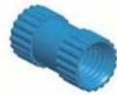
Copper Nut(6PCS) Material:Copper Standard:M4*10 Color:Copper