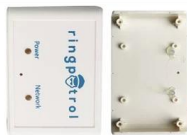
HOT MELT TREATMENT