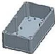
Hypotheca (1PCS) Material:ABS Color:Light Grey(FS20412)