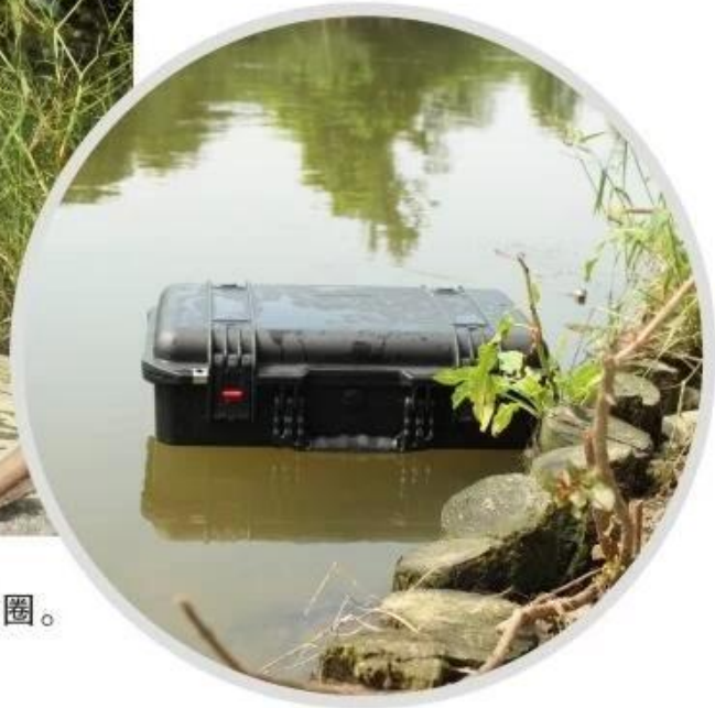
采用德国设备、密封极好的一体式密封圈。 防水、防潮密闭性极好。