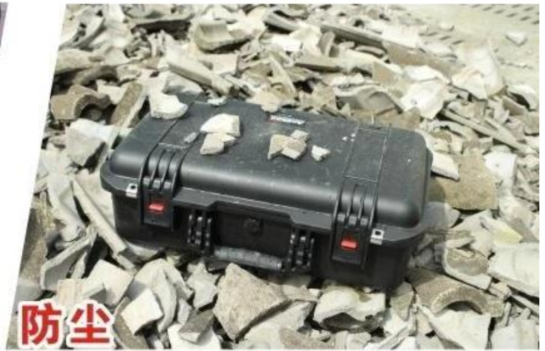
密封式设计 防止沙尘进入箱体