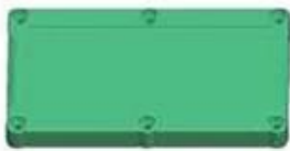
Epitheca (1PCS) Material:ABS Color:Light Grey(FS20412)