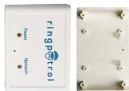
HOT MELT TREATMENT