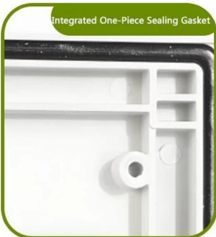
Integrated One-Piece Sealing Gasket