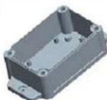
Hypotheca (1PCS) Material:ABS Color:Light Grey(FS20412)