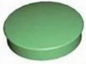
Screw Lid(6PCS) Material:ABS Color:Light Grey(FS20412)