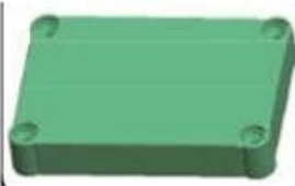
Epitheca (1PCS) Material:ABS Color:Light Grey(FS20412)