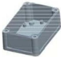
Hypotheca (1PCS) Material:ABS Color:Light Grey(FS20412)