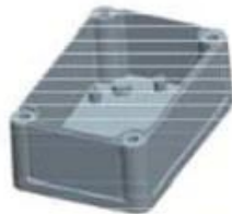
Hypotheca (1PCS) Material:ABS Color:Light Grey(FS20412)