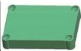
Epitheca (1PCS) Material:ABS Color:Light Grey(FS20412)