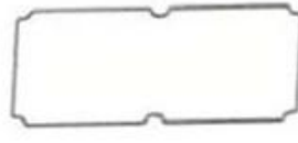
Gasket (1PCS) Material:Rubber Size:96.5*64.5*1.8 mm