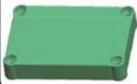
Epitheca (1PCS) Material:ABS Color:Light Grey(FS20412)