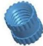
Copper Nut(4PCS) Material:M4*5 Color:Copper