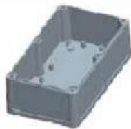
Hypotheca (1PCS) Material:ABS Color:Light Grey(FS20412)