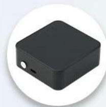
MOQ 1 PIECE