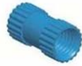
Copper Nut(6PCS) Material:Copper Standard:M4*10 Color:Copper