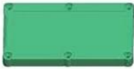
Epitheca (1PCS) Material:ABS Color:Light Grey(FS20412)