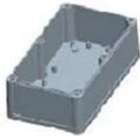
Hypotheca (1PCS) Material:ABS Color:Light Grey(FS20412)