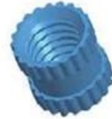
Copper Nut(4PCS) Material:M4*5 Color:Copper