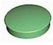
Screw Lid(6PCS) Material:ABS Color:Light Grey(FS20412)