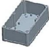
Hypotheca (1PCS) Material:ABS Color:Light Grey(FS20412)