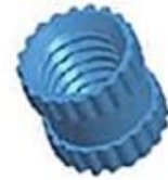
Copper Nut(4PCS) Material:M4*5 Color:Copper