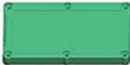
Epitheca (1PCS) Material:ABS Color:Light Grey(FS20412)