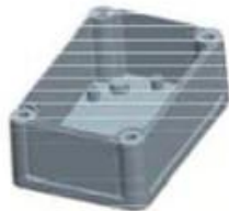
Hypotheca (1PCS) Material:ABS Color:Light Grey(FS20412)