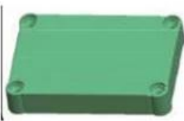
Epitheca (1PCS) Material:ABS Color:Light Grey(FS20412)