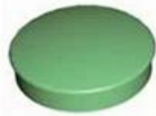
Screw Lid(6PCS) Material:ABS Color:Light Grey(FS20412)