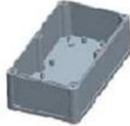
Hypotheca (1PCS) Material:ABS Color:Light Grey(FS20412)