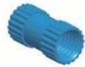
Copper Nut(6PCS) Material:Copper Standard:M4*10 Color:Copper