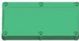
Epitheca (1PCS) Material:PC Color:Transparent