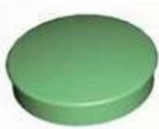
Screw Lid(6PCS) Material:ABS Color:Light Grey(FS20412)